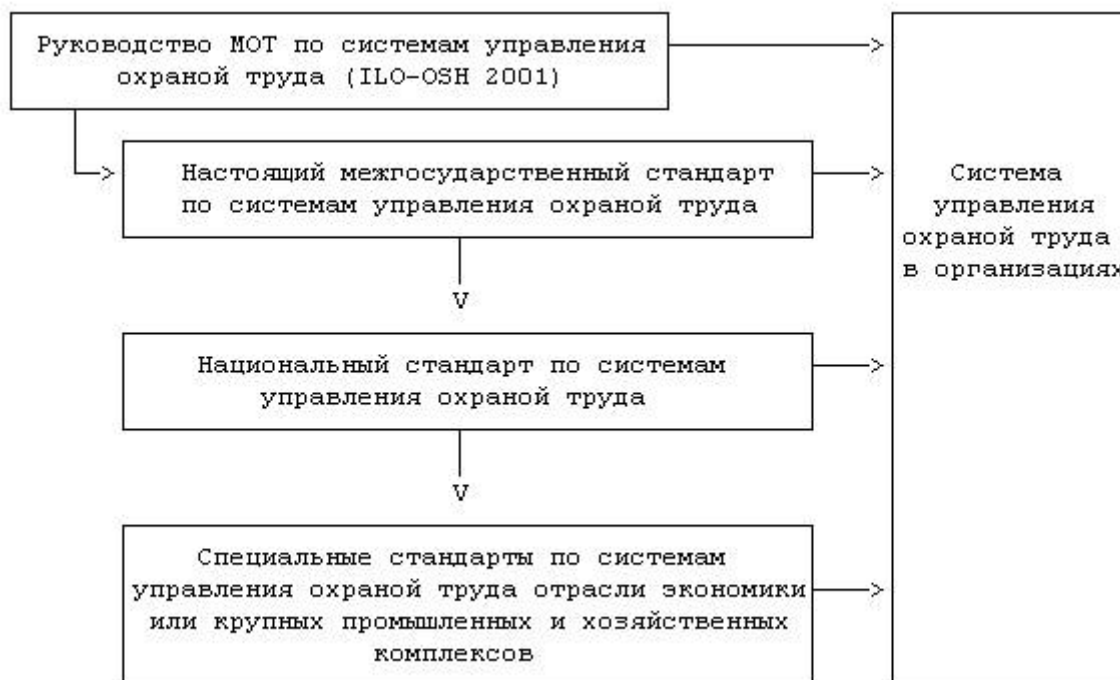
Рисунок 1. Элементы национальных структур систем управления охраной труда